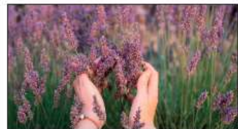
Au-delà de son pouvoir Instagramable, la lavande a des propriétés médicinales.