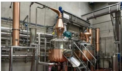
L'alambic utilisé pour la distillation des plantes aromatiques.

LA PME EXPORTE 49% DE SA PRODUCTION Les Distilleries et Domaines de Provence ont été repérés après la Seconde Guerre mondiale par Henri