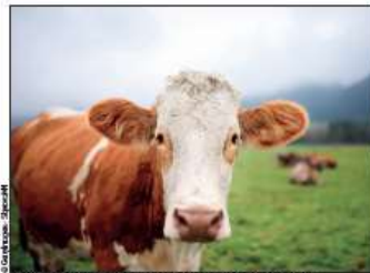
A l'image de la ferme du Buissonnet, l'UE soutient le localisme.

La région Sud représente une surface arborée importante, régulièrement exposée aux risques d'incendie. Le débroussaillage aux abords des forêts du Vaucluse permet de réduire la vitesse de propagation du feu, donc la surface détruite, et de minimiser l'apparition de feux importants, pour une forêt plus préservée. Celle-ci renforce la biodiversité, le stockage de CO2, et offre une matière première pour la filière agricole. C'est pourquoi l'UE a déjà financé plus de 450 projets locaux depuis 2014, soit 12 millions d'euros d'ici 2023 aux côtés des collectivités.