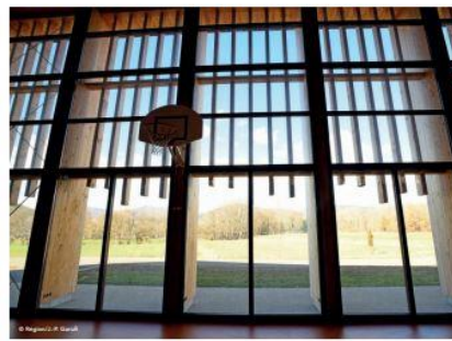
Le gymnase du lycée Carmejane a été construit avec du Bois des Alpes.